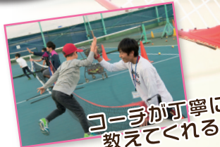
コーチが丁寧に 教えてくれる