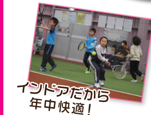
インドアだから 年中快適!